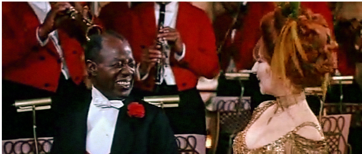
Foto: Screenshot de Louis Armstrong e Barbra Streisand em trailer do filme Hello, Dolly! (1969).